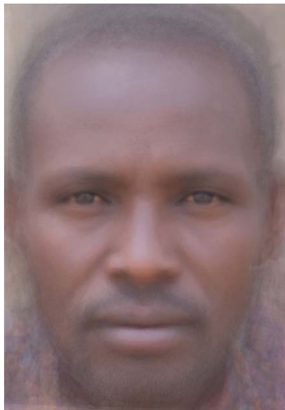
Рис. 3. Обобщенный фотопортрет мужчин датога