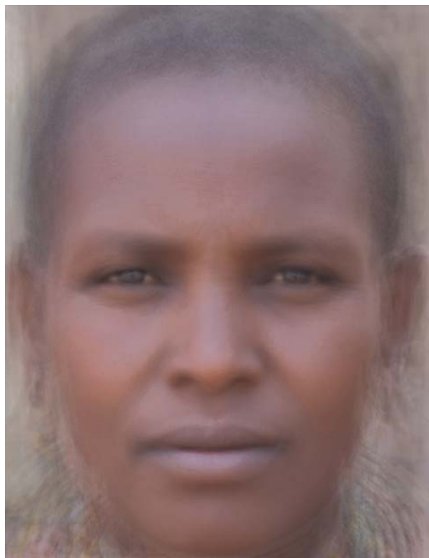
Рис. 2. Обобщенный фотопортрет женщин датога