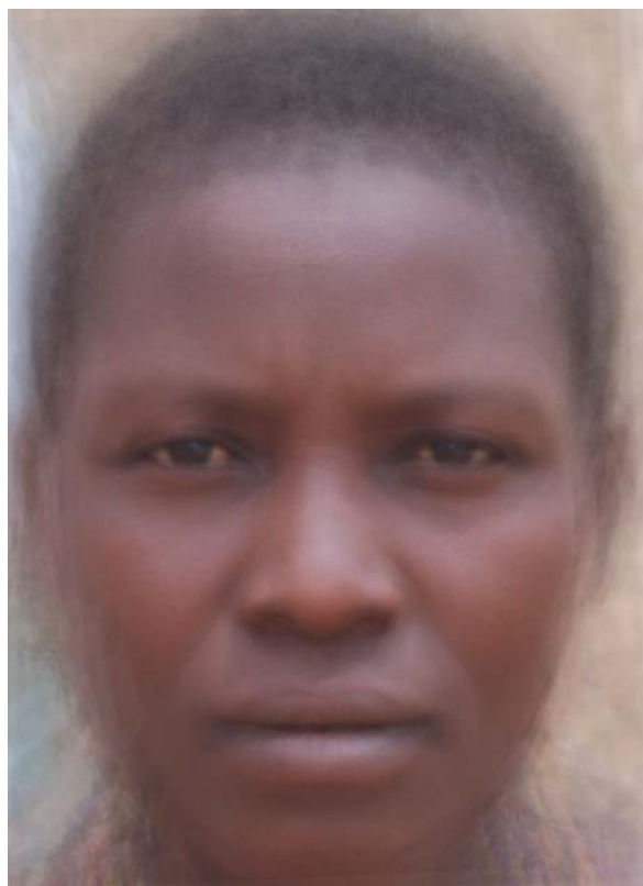
Рис. 4. Обобщенный фотопортрет женщин хадза